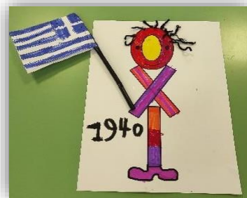
Βασιλική Καμουλάκου Α΄2