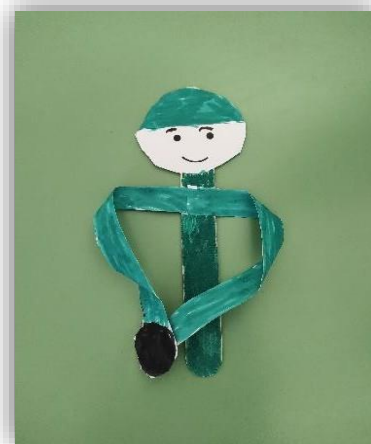
Δημήτρης Φουστέρης Α΄1